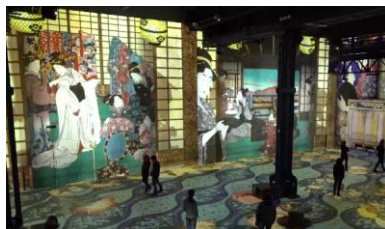
Carrières de Lumières : Japon rêvé, images du monde flottant, Du 22 février au 31 décembre 2019