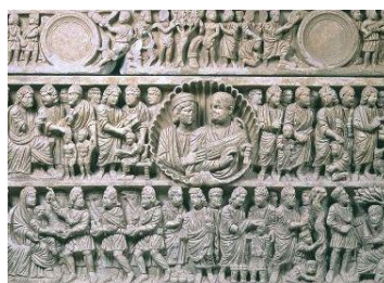
Musée départemental Arles Antique :

Tous les dimanches à 15h00 Visite guidée des collections permanentes Le Musée en 15 chefs-d'œuvre